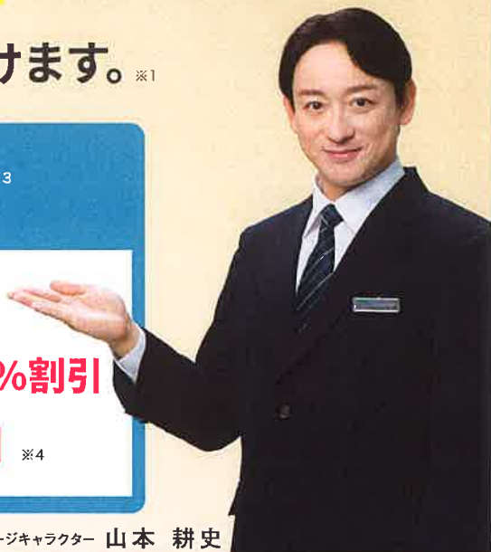
イメージキャラクター 山本 耕史