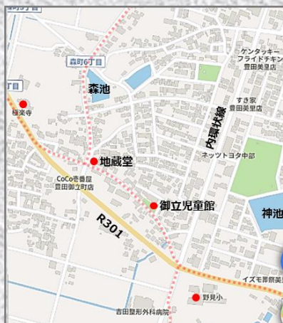
2025年 Google Maps参照