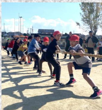
親子混合でファイト！