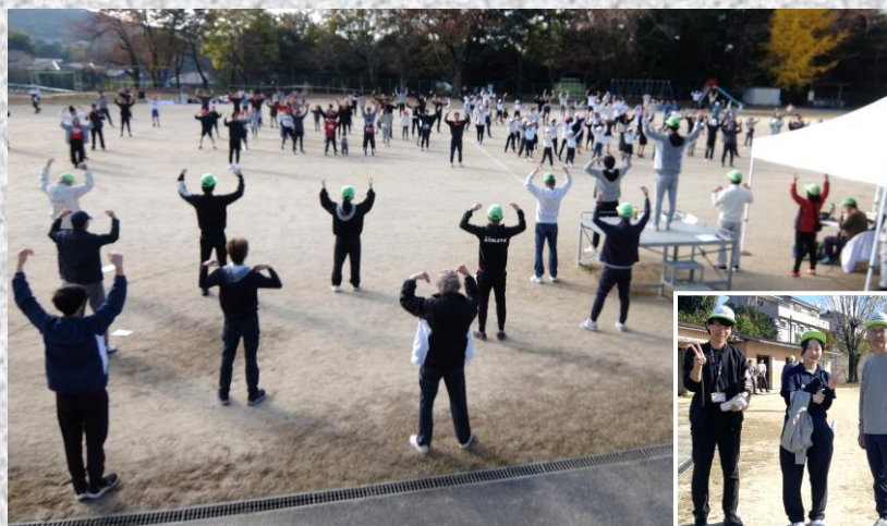
まずは準備体操で体をほぐして

秋晴れの下、 小学生からシルバー世代約100人が集い 、紅白対抗で7種目を競い合いました。定番の『ジャンケンバトル』、人気の『ティラノザウルスレース』、全員参加の『大玉送り&転がし』など大いに盛り上がりました。勝敗は激戦の末、 紅組が昨年のリベンジを果たしました 。各競技、三世代皆の 笑顔や歓声があふれる楽しい時間 を過ごせました。