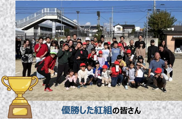
優勝した紅組の皆さん