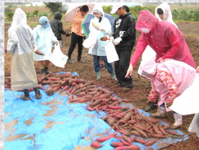
型の良い芋がたくさん採れました

10月4日、あいにくの雨模様でしたが、環境保全会、白寿会の皆様のご指導ご協力で子ども会の約80人が参加してサツマイモの芋ほり体験を（景観作物栽培圃場にて）行い、あつあつの石焼き芋も試食しました。