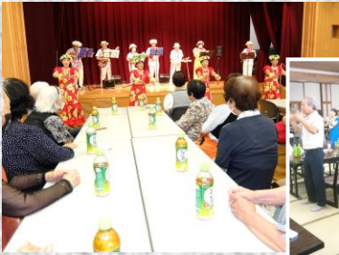
ハワイアンと昭和歌謡

敬老会という名称を改め、今年は昭和100年にあたるといことで、自治区を支えながら昭和を駆け抜けてこられた皆さんの 笑顔があふれ、和が生まれる会 と命名しました。