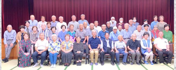
昭和生まれの皆さん、笑顔で はいチーズ！