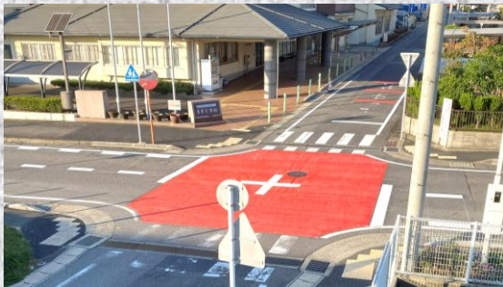
クルマ、人双方の注意喚起の赤色塗装を行いました