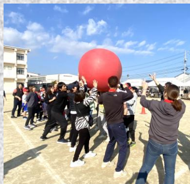
全員参加で玉送り