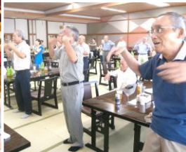
ハワイアン踊りました