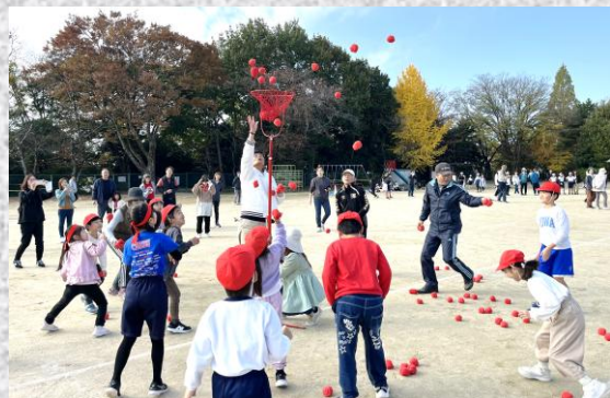
三世代力あわせて