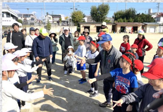
世代を超えて真剣勝負