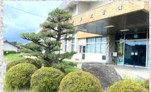
御立児童館のシンボル木の剪定を行いました