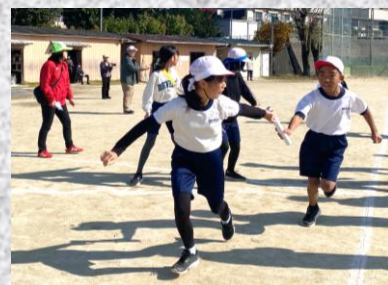
紅白勝敗をかけた 大会のクライマックス