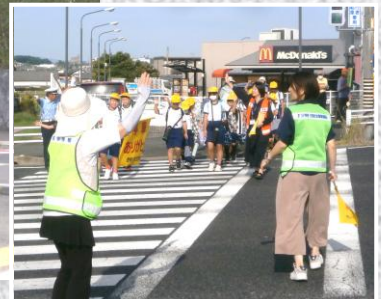
9月22日 学童登校の見守りを実施