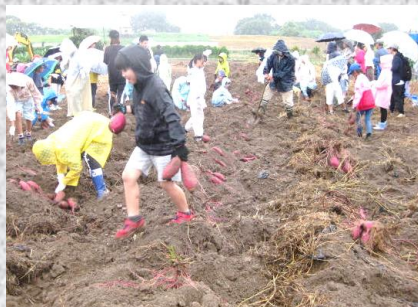
とにかく芋ほりは楽しい！