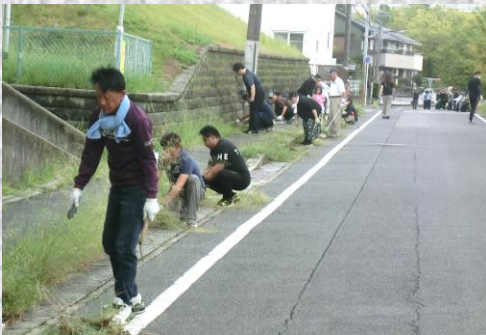
9月14日 自治区内の草刈りを実施