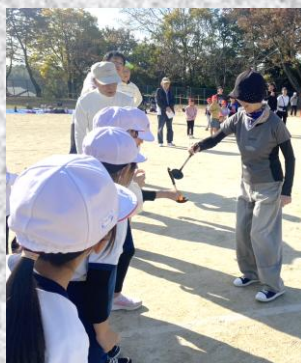
おたまでリレーは ここがポイント