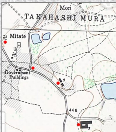
1945年 昭和20年米軍地図参照