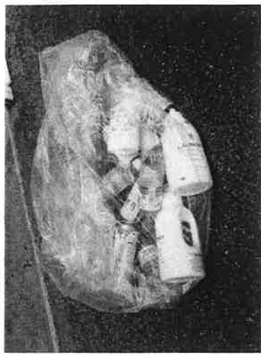
東高前ゴミステーション： ビニール袋に燃やすごみ、ペット ボトル他混在