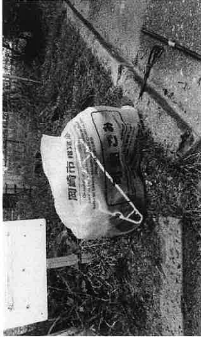
美里中学南ゴミステーション： 指定外ゴミ袋に燃やすごみ他混在