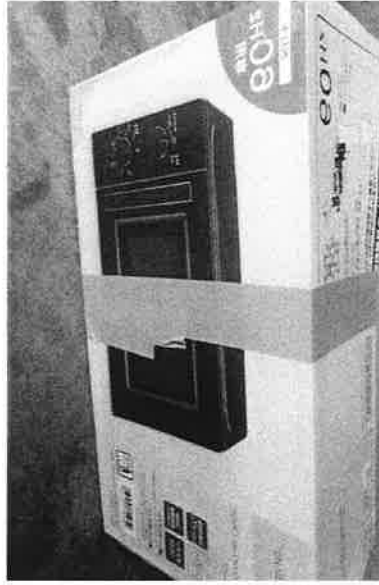
神池東ゴミステーション： 粗大ゴミ（電子レンジ）