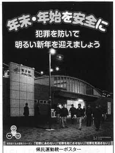
県民運動統一ポスター

この運動は、県民一人一人が防犯意識を高め、県民総ぐるみの安全なまちづくり活動をとって、犯罪を起こさせない環境作りに取り組むことにより、安全で安心して暮らせる社会の実現を目指すものです。