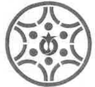
防犯あいちシンボルマーク