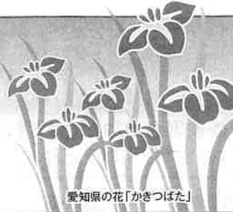
愛知の花「かきつばた」

発行所：(公社)愛知県防犯協会連合会 名古屋市昭和区円上町26番15号 (愛知県高辻センター 2階) (052) 871-2110