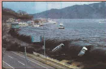
東日本大震災（2011年3月）