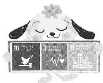
美里交流館キャラクター タクトくん